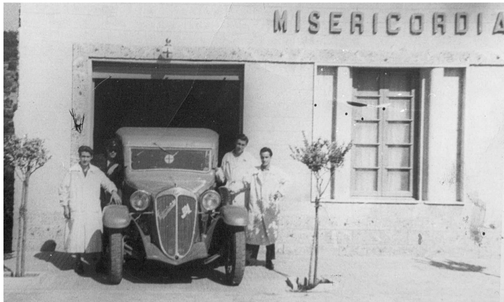
Fiat 508 3 marce - Prato

si misero sul mercato mezzi ben affidabili e discretamente confortevoli. Per ottenere il massimo spazio possibile alcune versioni erano globalmente allargate nella carrozzeria rispetto allo standard, diffusissima la soluzione strutturale di uno sbalzo posteriore allungato. La mancanza di telai a passo lungo per questi modelli costringeva una soluzione di alloggiamento della barella che invadeva la cabina di guida a lato del conducente; a fianco della barella rimaneva spazio sufficiente per una panchetta o strapuntinatura, lavandino e piccolo contenitore di materiale sanitario. L'accesso al vano sani-